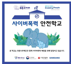
<인증 현판 1개>