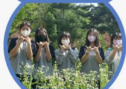
푸른 약속 캠페인 진행