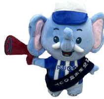
<선언 인형 1개>