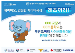
<선언 판넬 1개>