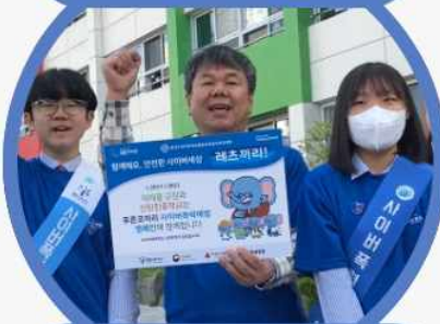
푸른 선언운동 캠페인 진행