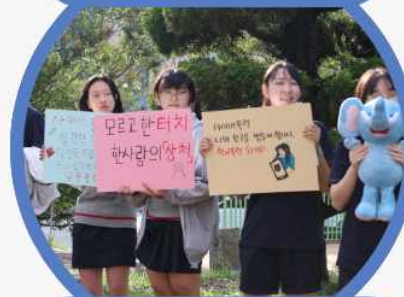
푸른 등굣길 캠페인 진행