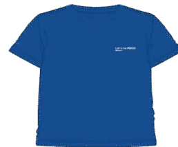
<선언 티셔츠 6개>